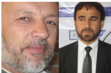
اعضای ارشد هر دو کمیسیون قبل از رفتن به طرف انتخابات پارلمانی... ادامه صفحه ۶

این حقوق دانان، اعضای کلیدی این کمیسیون ها را متهم به جانبداری از نامزد خاص در انتخابات ریاست جمهوری و گرفتن رشوه برای برنده کردن شماری از نامزاد شورای های ولایتی کرده می گویند، هر دو کمیسیون مسوول تقلبات سازمان یافته در انتخابات ریاست جمهوری هستند. به باور آنان، عدم بی طرفی کمیسیون های انتخابات سبب بی باوری مردم نسبت به انتخابات شده و این بی باوری ممکن است که در شرکت مردم در انتخابات پارلمانی اثر منفی بگذارد؛ بنابراین