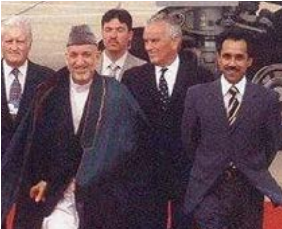
«این افغانستان همین طور آمده و به همین رقم به پیش می رود.» (حامد کرزی)

شاید هم آقای حامد کرزی با واقع بینی و به درستی دریافته بود که به صراحت برایم می گفت: «بسیاری از گپ‌هایت را نمی فهمم، اما برادرانه برایت می گویم، این افغانستان همین طور آمده و به همین رقم به پیش می رود، بسیار خود ره زحمت ندهید، بیا گپ‌های من...» ادامه صفحه ۶