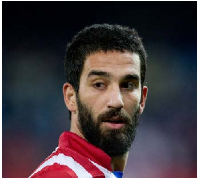
بازیها را به نمایش گذاشت و یکی از تاثیر گذارترین بازیکنان تیم دوم شهر مادرید بود.

هافبک جدید آبی - اناریها می گوید که حضور در تیم بزرگی چون بارسلونا برای او و کشورش ترکیه بسیار مهم است و به خود می بالد که در تیم بزرگی چون بارسلونا بازی می کند. بدون شک می توان گفت که آردا توران صید بزرگ بارسلونا در فصل جابجایی تابستانی سال جاری بوده است. این هافبک ترک تبار بعد از اعلام جدایی از اتلتیکو مادرید مشتریان زیادی داشت اما در نهایت تصمیم گرفت که بارسلونا را به عنوان مقصد بعدی خود انتخاب کند. توران وارد شهر بارسلونا شد تا از نزدیک با باشگاه جدید خود آشنا شود و چند عکس یادگاری در جاهای مهم این باشگاه بگیرد. او از اینکه بارسلونا را به عنوان تیم بعدی خود انتخاب کرده است بسیار خوشحال است و تاکید کرد که به عنوان یک ترکیه ای بازی کردن در تیم بزرگی چون بارسلونا برایش بسیار مهم است. او گفت: بسیار خوشحال هستم که چنین تصمیم بزرگی را گرفته ام. بازی کردن در تیم بزرگی چون بارسلونا به من کمک بسیار زیادی می کند همچنان که به عنوان یک ترکیه ای هم حضور در بارسلونا برای کشورم مهم است. من به خود می بالم که عضو باشگاه بزرگی چون بارسلونا هستم و نهایت تلاش خود را به کار می گیرم تا بهترین بازیهایم را برای این تیم به نمایش بگذارم. او ادامه داد: امروز روز بزرگی برای من است. انگیزه بسیار زیادی برای شروع با بارسلونا دارم. من از نظر روحی در بهترین شرایط قرار دارم چرا که به آروزی خود رسیده ام. من فرد بلند پروازی هستم و برای کسب موفقیت های زیادی به بارسلونا آمده ام. امیدوارم که تجربه خوبی در تیم جدید خود داشته باشم. توران چهار سال پیش با ۱۳ میلیون یورو راهی اتلتیکو مادرید شد و در این تیم بهترین