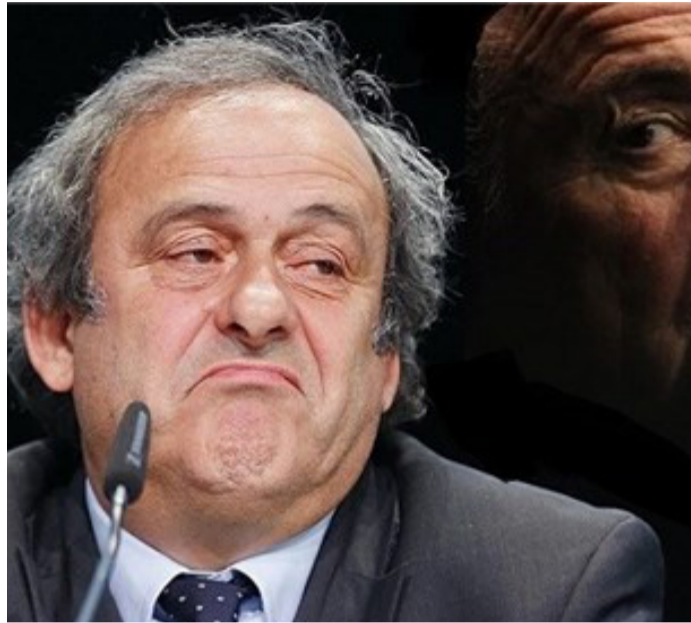
انتخابات ریاست فیفا در تاریخ ۲۶ فبروری ۲۰۱۶ برگزار می شود تا جانشین سب بلاتر مشخص شود. میشل پلاتینی، رییس اتحادیه فوتبال اروپا (یوفا) یکی از کاندیداهای تکیه بر صندلی ریاست فیفاست.

رییس فیفا مدعی شد پلاتینی او را تهدید کرده که به زندان خواهد انداخت. در اواخر ماه می ۲۰۱۵ پس از بر ملا شدن فسادهای اداری و مالی در فدراسیون جهانی فوتبال، به درخواست مستولان قضایی آمریکا شماری از مستولان این نهاد و رابطان آنها توسط پلیس سوییس دستگیر شدند تا تحقیقاتی در این زمینه صورت بگیرد. در پی این ماجرا، سب بلاتر در تاریخ دوم جون ۲۰۱۵ (۱۲ خرداد) به فاصله چهار روز پس از انتخاب شدنش به عنوان رییس فیفا برای پنجمین دوره متوالی، از سمت خود کناره گیری کرد. رییس سوئیسی فدراسیون جهانی فوتبال مدعی شده میشل پلاتینی، رییس اتحادیه فوتبال اروپا (یوفا) که خود کاندیدای ریاست انتخابات پیش روی فیفا شده، در پشت پرده دست به کارهای کثیفی زده است. بلاتر در گفت و گو با روزنامه هلندی «De Volkskrant» گفت: پلاتینی یک روز که با برادر من برای خوردن ناهار دور یک میز نشسته بودند به او گفته که سب باید پیش از انتخابات کنار بکشد یا اینکه به زندان خواهد افتاد. یک شاهد عینی که نامش فاش نشده به این روزنامه هلندی گفت که در پی این اظهار نظر پلاتینی، اشک برادر بلاتر در آمده است. پلاتینی از اظهار نظر در این خصوص طفره رفته هر چند یکی از اعضای اتحادیه فوتبال اروپا گفت: این داستان دورغین، تازه ترین مجموعه تلاش های فیفا برای منحرف کردن اذهان عمومی از مشکلات حقیقی که فیفا با آن دست و پنجه نرم می کند، است. وی افزود: پلاتینی ترجیح داده که پاسخ این اتهامات مضحک را ندهد. رییس یوفا در حال حاضر در حال تهیه برنامه ای است تا بتواند از آن طریق به فدراسیون جهانی فوتبال کمک کند تا چهره و شهرت خود را از فساد پاک کند.