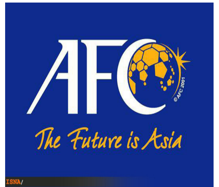
رییس کنفدراسیون فوتبال آسیا اعلام کرد که در انتخابات ریاست فدراسیون بین المللی فوتبال (فیفا) از میشل پلاتینی حمایت خواهد کرد. به گزارش سایت الکاس قطر، هر چند قرار است که شاهزاده بن حسین اردنی

بن حسین اردنی در دوره قبل تنها رقیب جدی بلاتر بود که در نهایت برابر این پیرمرد سوئیسی رقابت را واگذار کرد. پلاتینی در دور قبل خود را نامزد نکرد، چرا که به خوبی می دانست با وجود بلاتر شانس برای پیروز شدن ندارد اما الان که بلاتر کنار رفته است رییس اتحادیه فوتبال اروپا وقت را غنیمت شمرده و از حمایت بیشتر کشورهای اروپایی برخوردار است و شانس نخست پیروزی در انتخابات است.