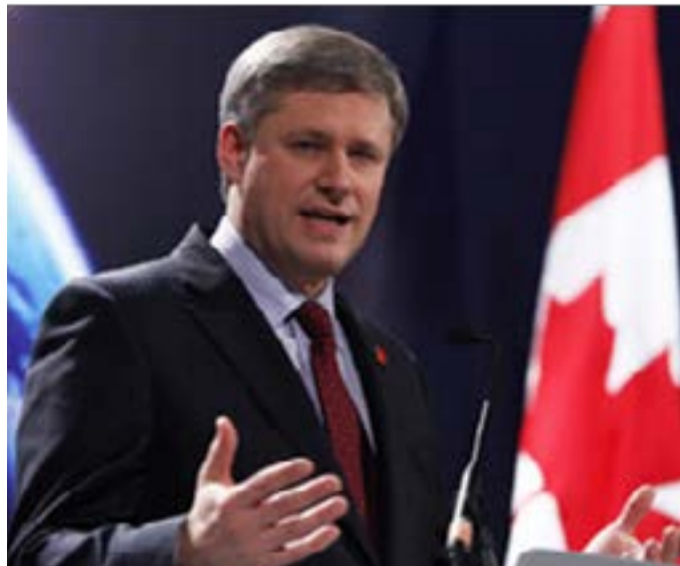
نخست‌وزیر کانادا تاکید کرد، ایتلاف ضد داعش تحت رهبری امریکا آنچنان که امید بسته بودیم در سوریه و بخش‌های عراق خوب پیش نمی‌رود.

وی با توجه به این مساله گفت: برای حفاظت از کشورمان باید یک استراتژی پایدار و طولانی مدت و همکاری نزدیکی با شرکای بین‌المللی مان داشته باشیم و این کاری است که ما در حال حاضر انجام می‌دهیم.