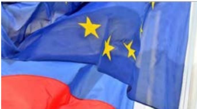
هایی را علیه مسکو اعمال اما روسیه تاکید کرده است که این تحریم‌ها نتیجه معکوس به همراه خواهد داشت.

خبرگزاری اسپوتنیک به نقل از «اسپیروس کوویلس» رییس شورای تجاری یونان-اوراسیا که معاون سابق وزیر خارجه یونان نیز بود، اعلام کرد که اتحادیه اروپا بزودی در سیاست‌هایش در قبال روسیه بازنگری خواهد کرد و تمرکز خود را بر مساله همکاری متمرکز می‌کند.