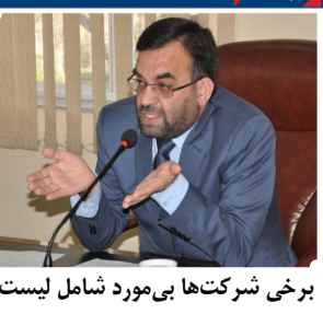
برخی شرکت‌ها بی‌مورد شامل لیست سیاه کمیسیون تدارکات می‌شوند