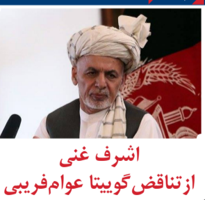
اشرف غنی از تناقض گوییتا عوام فریبی