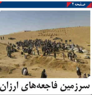
سرزمین فاجعه‌های ارزان