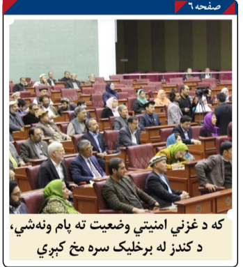
که د غزنی امنیتی وضعیت ته پام ونه شي، د کندز له برخلیک سره مخ کېږي