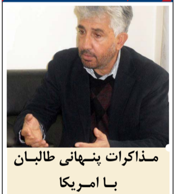
مذاکرات پنهانی طالبان با امریکا