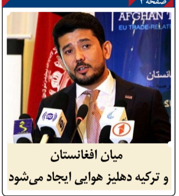
میان افغانستان و ترکیه دهلیز هوایی ایجاد می شود